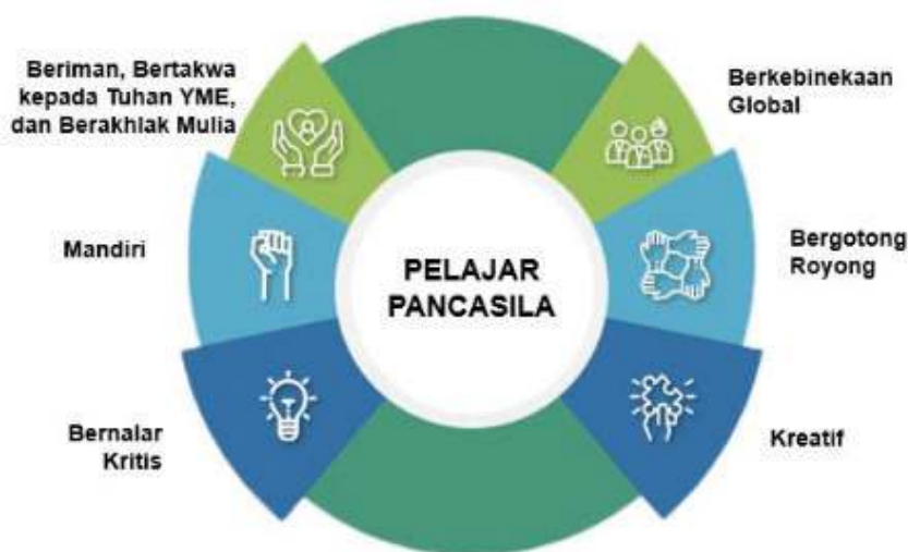
Gambar 2.2 Profil Pelajar Pancasila

Pemerintah sedang giat mensosialisasikan “Profil Pelajar Pancasila”. Apa itu pelajar Pancasila?