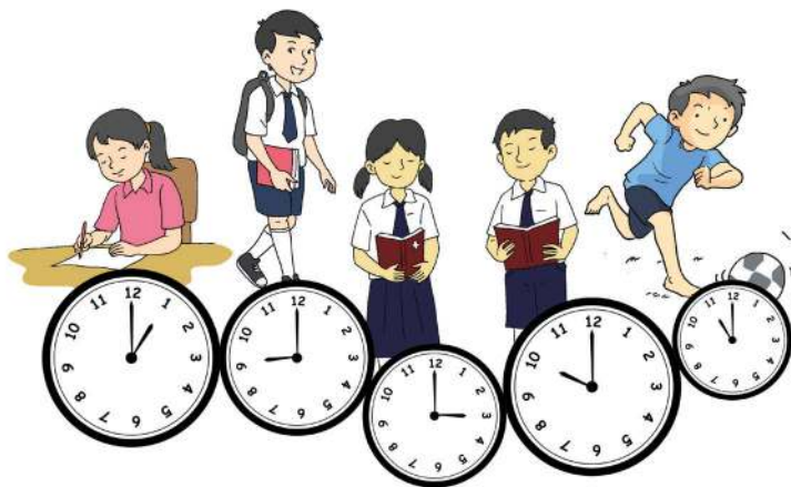
Gambar 5.3 Kegiatan Sehari-hari

Institusi sekolah dan keluarga adalah dua institusi penting yang menjadi dasar atau fondasi bagi tumbuh-kembangnya disiplin hidup. Disiplin amat diperlukan dalam rangka mengatur perilaku dan tata kehidupan manusia apalagi untuk anak-anak, remaja, dan kaum muda. Ada pakar psikologi yang mengatakan, perilaku manusia setelah dewasa sangat ditentukan oleh pola asuh dan disiplin yang ditanamkan sejak kecil. Disiplin menjadi prasyarat penting dalam pembentukan sikap, perilaku, dan tata kehidupan.